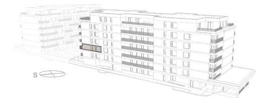
POHLED - BUDOVA A

Poznámka: Vyobrazení bytové jednotky, jejího vybavení (zařízení, nábytku, kuchyňské linky, spotřebičů apod.) a situace území je pouze informativní. Vybavení není součástí dodávky bytové jednotky. Uvedené rozměry jsou pouze orientační a mohou doznat změn. Finální provedení bytové jednotky bude stanoveno dohodou o prodeji bytové jednotky, uzavřenou mezi prodávajícím a kupujícím. Proávající si vyhrazuje právo na změny.